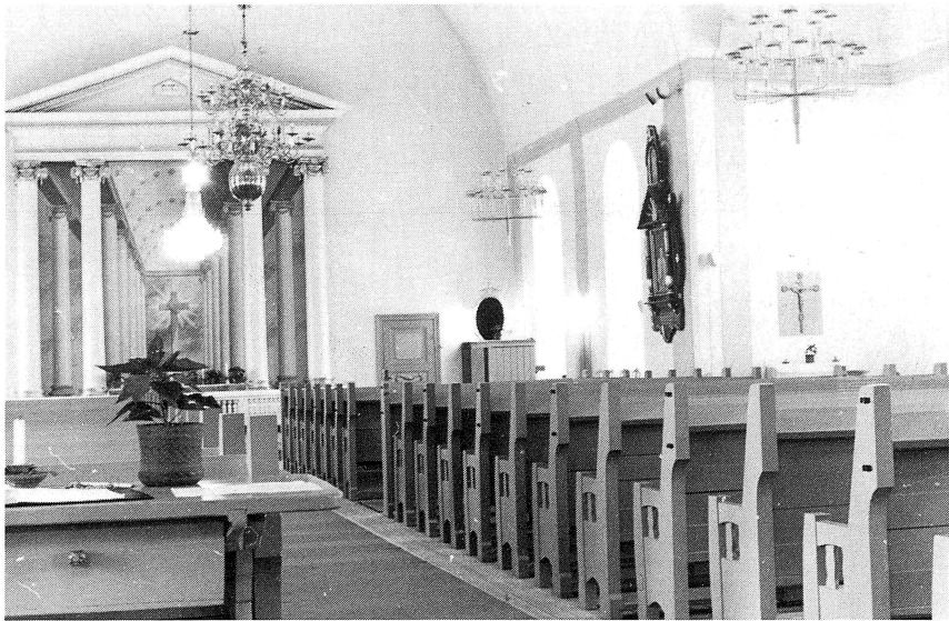
Interiör av Sollerö kyrka med Jugen Jons epitafium på södra långväggen till höger om koret.