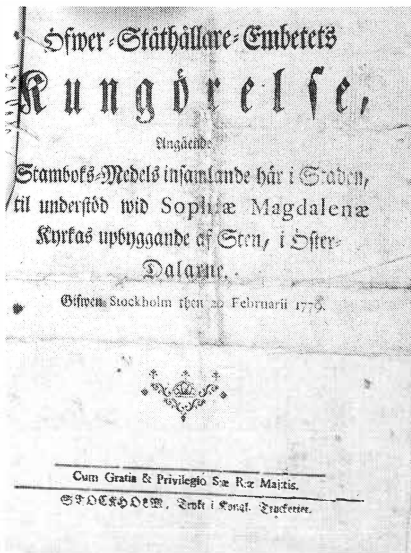
Foto av Överståthållarämbetets i Stockholm kungörelse som medger för sollerö-folk att samla in "stambokmedel" till kyrkobygget. Kungörelsen är daterad 20 februari 1779.

den första gudstjänsten i ett oinrett kyrkorum. Tornbyggnaden påbörjades följande år. Efter några års uppehåll stod byggnaden klar 1785. Nästa år fanns bänkinredning på plats och 1788 byggdes läktare.